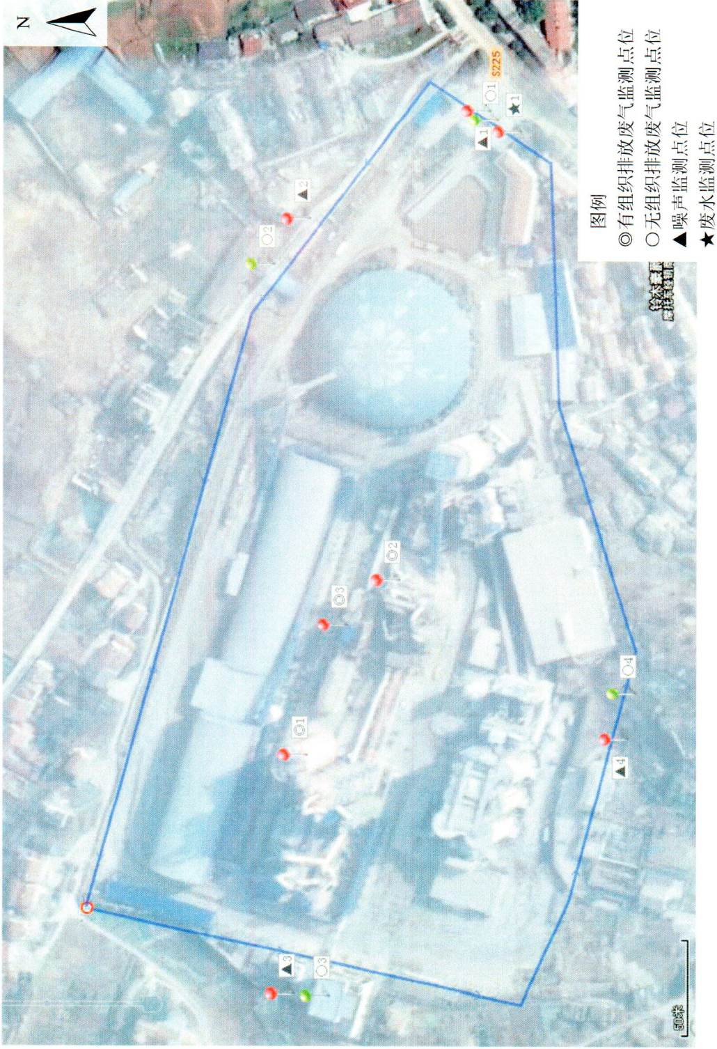
附图 1：监测点位示意图