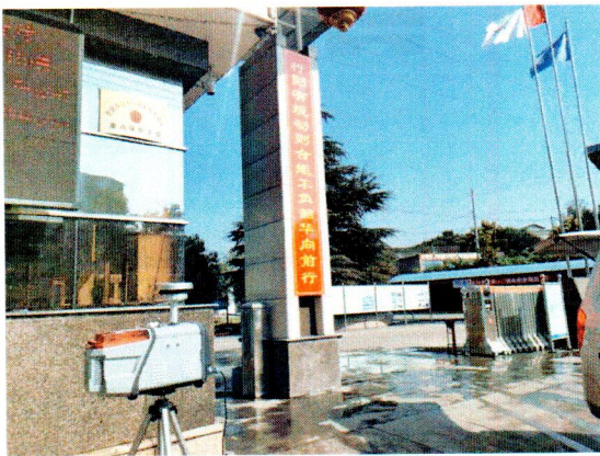
厂界东侧-上风向无组织排放废气监测点位 (○1)