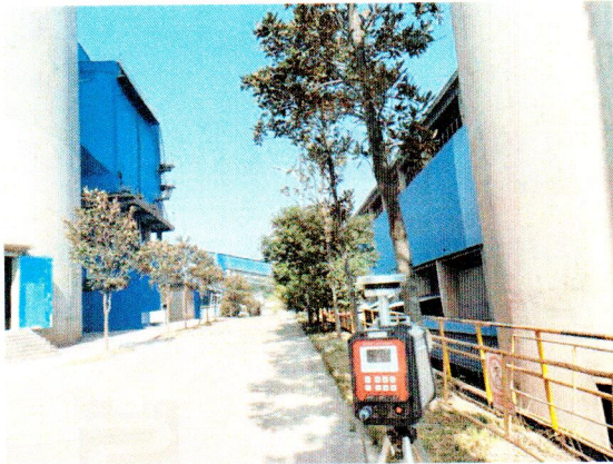
厂界西侧-下风向无组织排放废气监测点位(○3)