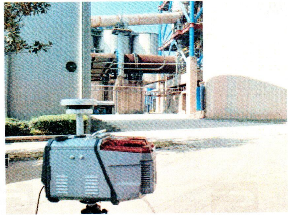
厂界南侧-下风向无组织排放废气监测点位(○4)