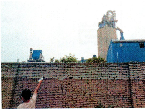
厂界东侧噪声监测点位 (▲1)