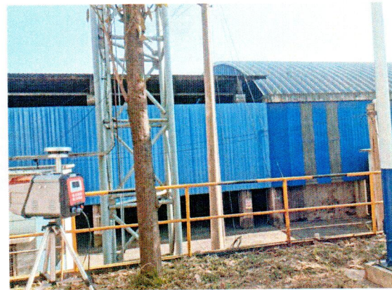
厂界东北侧-下风向无组织排放废气监测点位 (○2)